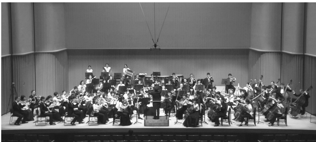
第17回定期演奏会 トヴォルジャーク：交響曲第7番 他 2018.7.22 東海市芸術劇場大ホール

ブランタン管弦楽団は、2000年に結成されたアマチュアオーケストラで、出身地や職業が多様なメンバーで構成されています。毎年夏に定期演奏会、隔年冬にウィンターコンサートを開催しています。今回の定期演奏会では、ブラームスとベートーヴェンのダブルシンフォニー、また弊団としては3曲目となる邦人作品を取り上げます。