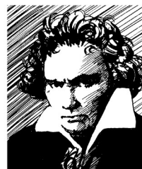
Ludwig van Beethoven 1770-1827 Germany