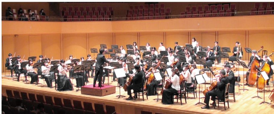
第19回定期演奏会 2021.6.20 愛知県芸術劇場コンサートホール

ブランタン管弦楽団は2000年に結成されたアマチュアオーケストラです。毎年夏に定期演奏会を行っており、今年は第20回定期演奏会を開催します。団の節目の演奏会にふさわしいよう華やかな曲目を選曲いたしました。一人でも多くの方に音楽を楽しんでいただくことを目指し、日々練習に取り組んでおります。団員一同、皆様のご来場を心からお待ちしております。